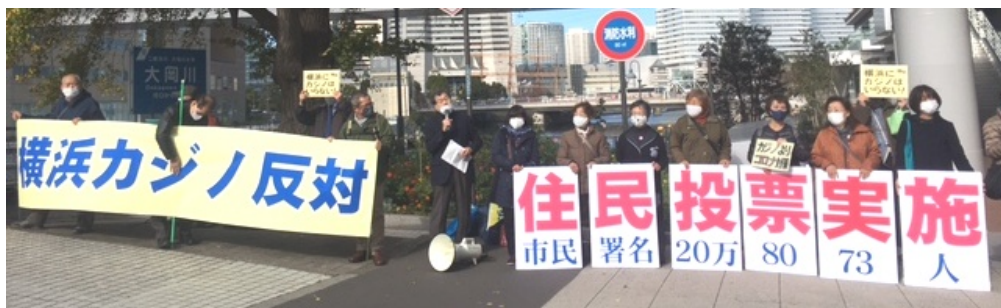
市役所前宣伝では「俺もカジノ反対!がんばって」と市民からの激励も(12/4)

発行元 カジノ誘致反対横浜連絡会 080-9747-6721 Fax 045-345-9664